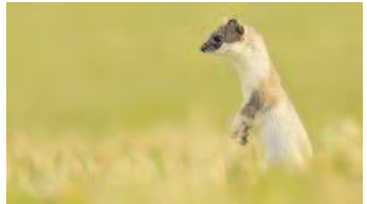
Une hermine en mue, et un pic noir qui nourrit ses petits. Par Sébastien.