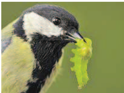
Une mésange charbonnière s'apprête à nourrir ses petits avec une chenille.