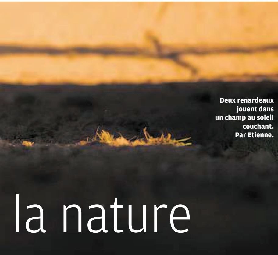
Deux renardeaux jouent dans un champ au soleil couchant. Par Etienne.